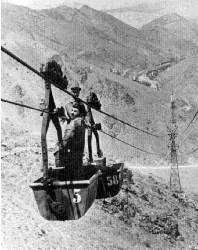
DİVRİĞİ ETİBANK İŞLETMESİNDE HAVAI HAT

A kafası: Site Merkezinin beş kilometre güneyindedir işçi pansiyonu havai hat teşkilatını haizdir,mevcut kafaların en büyüğü olduğu yukarıda temas ettiğimiz bu merkez elektiriğe,demir boru ile izale edilmiş suya da malidir.her gün .....amele çalıştırmaktadır.Buradan Cürek İstasyonuna uzatılan havai hattın uzunluğu 7 kilometredir.